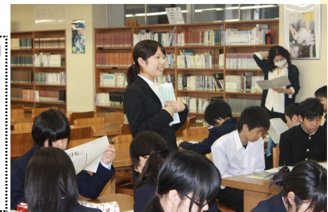
▲4月 1年生「図書館オリエンテーション」より